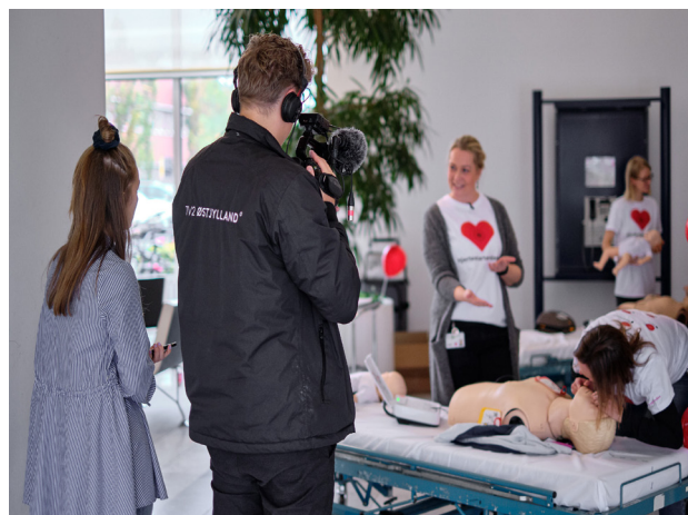
Aarhus Universitetshospital i Skejby afholdt Hjertestarterdagen på hospitalet, hvor mange borgere og pressen kiggede forbi.