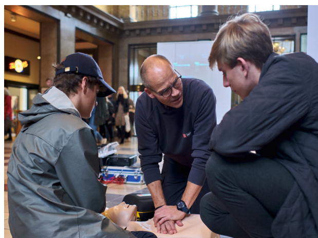
Falck holdt til på Aarhus Banegård, hvor rejsende - unge som ældre - øvede hjertelungeredning.