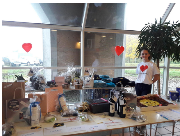
Slagelse Sygehus, Præhospitalet Center fra Region Sjælland og Hjerteforeningen holdt sammen et flot arrangement.